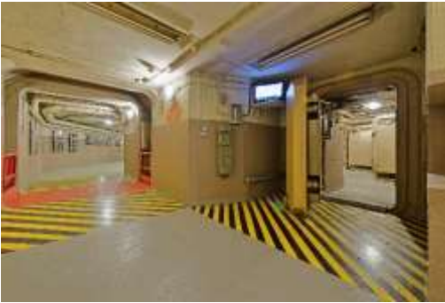
Grafik: Stefanie Ley / www.ahrtal.de

Familienführung in der Dokumentationsstätte Regierungsbunker – nächster Termin: 4. November